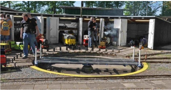
Bij de draaischijf was het al vroeg druk.

Op 5 en 6 mei jl. heeft de Maasoever Spoorweg Barendrecht weer haar Open dagen gehouden. Ik ben er op de zaterdagmorgen 5 mei heen geweest (Kopfoto) Het was een prachtige dag; schitterend weer en veel bezoekers. De spoorbaan van MSB ligt in een recreatiegebied aan de oever van de Oude Maas. De baan bestaat uit een lus van ca. 1000 meter met een brug en een tunnel. Er is een station met drie sporen bij het strandje met speeltuin, een depot met een draaischijf en een ringloods met 20 sporen. De hele baan is naast 7 ¼" tevens voorzien van een 5" spoor.