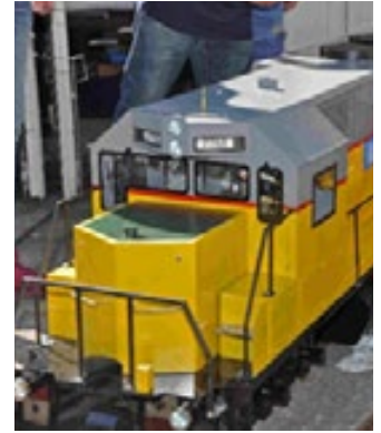
Amerikaanse elektrische locomotief met geluidsmoduul van Hans van Ee, werkend op batterij.